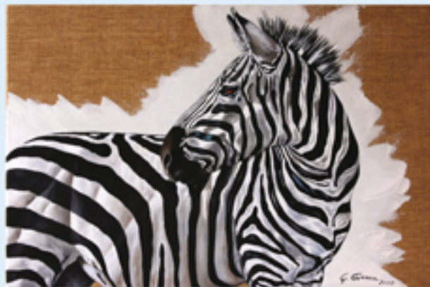
GIANNI CARREA Pittura