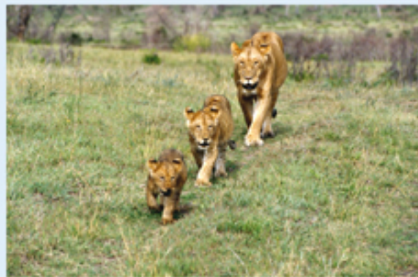
FERNANDO GALARDI Fotografia

www.museidigenova.it museodoria@comune.genova.it